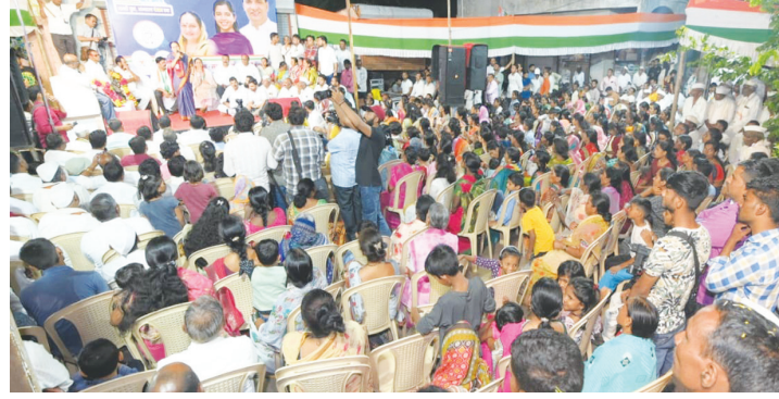
राहाता मतदार संघातील रहिमपूर, २८ गावांमध्ये झालेल्या विविध आर्थी,ओझर,मनोली,कनकापूर यांसह गावांमध्ये त्या बोलत होत्या. यावेळी