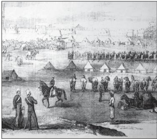
त्रिदश सैन्याचा नगर किल्ल्याला वेढा